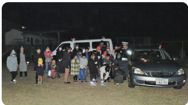
夜間の交通安全教室

ことや、対向車同士のライトが重なる、横断中の人が見えなくなる「蒸発現象」の実験を行いました。命を守るというこ