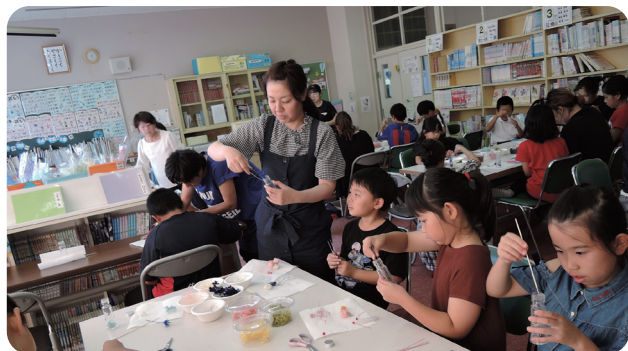
家庭教育学級 ハーバリウム作り

「今、話題になっていて、どこで学べるのか」という課題について、専門家を呼び解決しています。昨年度は、「ハーバリウム作り」と「ダンス教室」を行いました。