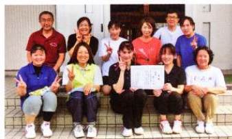
写真は優勝した電気チーム

1〜3学年混成の科ごとのチーム編成で、初めて顔を合わせる保護者の皆さんたちでしたけど、和気あいあいでケガも無く、楽しいミニバレー大会ができました。来年もより多くの方の参加を待ちしております。