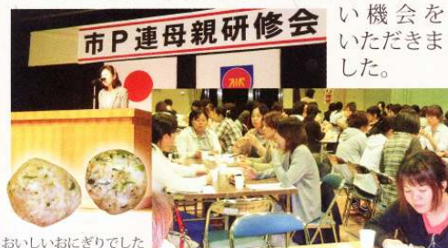
おいしいおにぎりでした

10月17日木曜日、市P連の母親研修会に行ってきました。輝北コミュニティーセンターにて、夜の開催でも約100名の参加があり、市食育サポーターの『今一度見直そう朝ごはん』というお話を伺いました。皆さん、「朝ごはんは食べたほうがいいよね・・・」とわかっていても、時間が無かったり、うまいかなかったりする人も多いですよ。鹿屋市の調査では、子どもだけでなく大人も朝食の欠食が多かったそうです。そこで、おにぎりや簡単にフライパンひとつでできるもの、電子レンジの活用などで、時間をかけずに用意できるものから始めようとの提案でした。ふりかけのレシピ紹介とそれを混ぜ込んだおにぎりの試食もあり、朝食を考えるいい機会をいただきました。